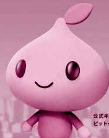
公式キャラクター ビットくん

「みんなでたすけあい、豊かで安心できる社会」の実現に向け、 皆さまとともに取り組んでいきます。